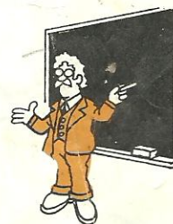
a la pizarra